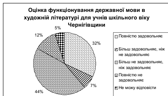
Діаграма 1. Оцінка функціонування державної мови в художній літературі для учнів шкільного віку в Чернігівській області

Результати відповідей респондентів на запитання: дайте оцінку функціонуванню державної мови в художній літературі для учнів шкільного віку, Чернігівської та Дніпропетровської областей для порівняння унаочнені в діаграмі 1, 2: