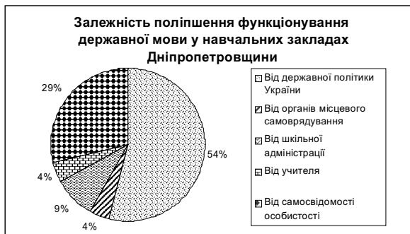
Діаграма 3. Залежність поліпшення функціонування державної мови у навчальних закладах Дніпропетровської області

Результати відповідей на запитання про залежність поліпшення функціонування державної мови у навчальних закладах Дніпропетровщини та Чернігівщини відображені в діаграмах 3,4: